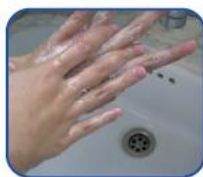
Aplique el jabón antiséptico (5 cc) y frote palma con palma.