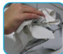
Cierre el grifo sin tocarlo directamente, utilizando una toalla de papel desechable.