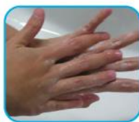
Frote la mano derecha sobre el dorso de la mano izquierda y viceversa.