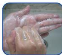
Restriegue el dorso de los dedos en la palma de la mano contraria.