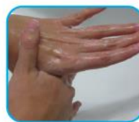
Lave ambos pulgares. Apriete y rote la mano contraria.