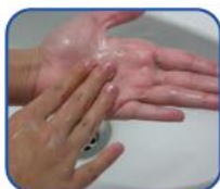
Frote en rotación, de atrás hacia delante, en ambas manos.